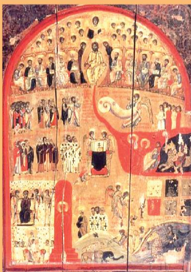
Страшный суд. Монастырь св. Екатерины. Синай. XI–XII века.