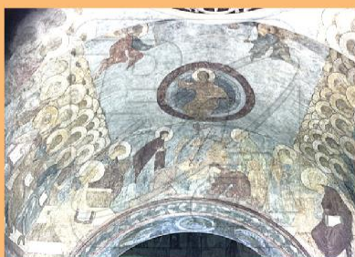
Андрей Рублёв. Фрески Страшного суда, 1408. Успенский собор.