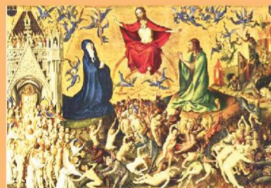
Стефан Лохнер. Страшный суд, 1435.