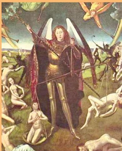
Ганс Мемлинг. Архангел Михаил. Страшный суд (фрагмент), альтарь Якопо Тани, 1473 год. Поморский музей, Гданьск, Польша.